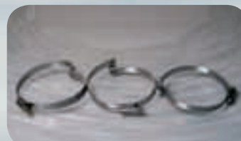
Brückenschelle für CL-Schläuche