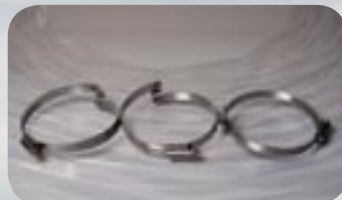
Brückenschelle für CL-Schläuche