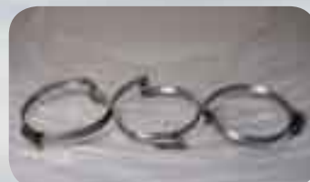
Brückenschelle für CL-Schläuche